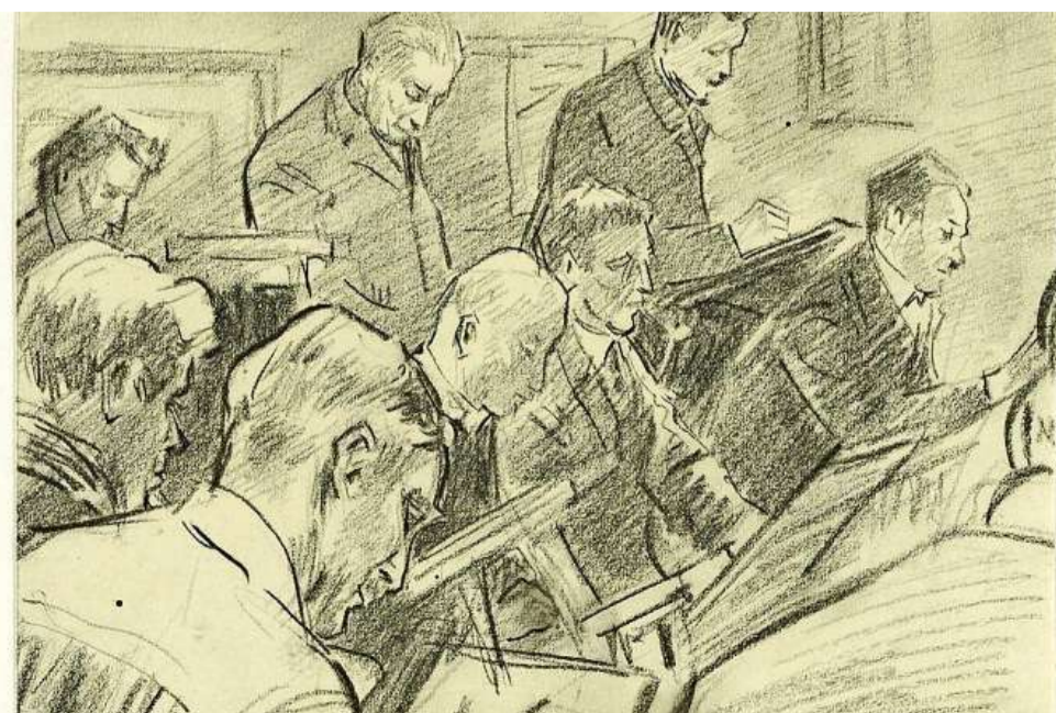
Gemaakt door Wiegman tijdens een tekenavond van Kunst Zij Ons Doel in 1932 in De Waag.