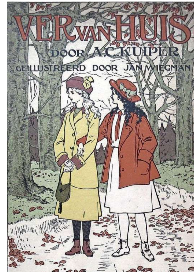
Illustratie en bandomslag van een meisjesboek, 1919.

BEELDEN HISTORISCHE VERENIGING HEEMSTEDE-BENNEBROEK