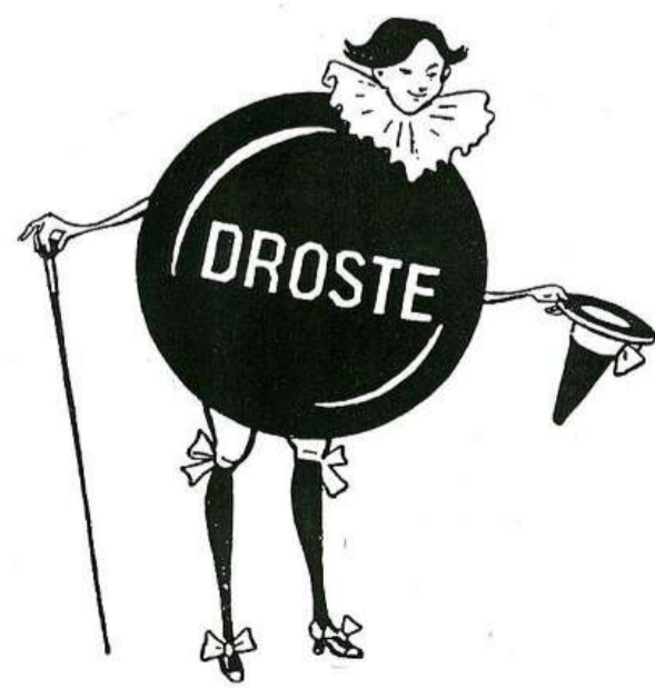
Wiegman's ontwerp van het Drostemannetje, 1923.