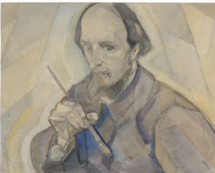
▲ Zelfportret met penseel, Herman Kruyder, 1917, Rijksmuseum.

Het leven van de kunstschilder Herman Kruyder speelde zich voor een groot deel af in de stilte van landelijke dorpen zoals Heemstede, Bennebroek en Blaricum. Daar vond hij zijn motieven: het landschap, het dorp, de mensen, dieren, bomen en bloemen.