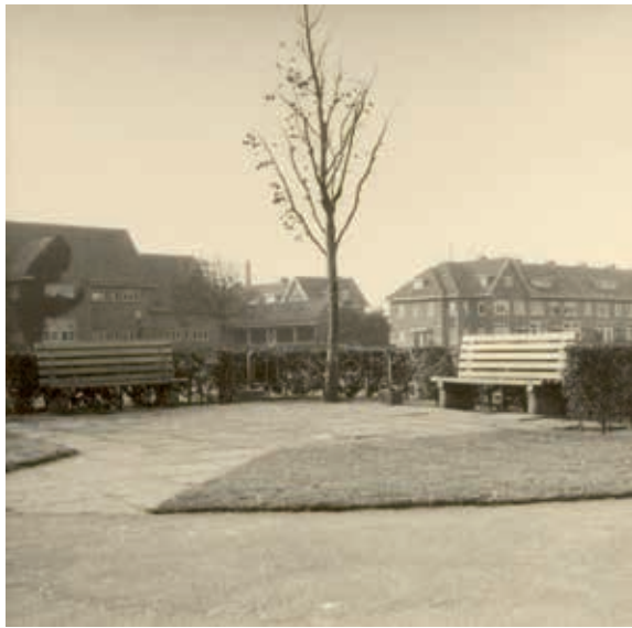
▲ De Juliana-boom met het hekje en de bankjes in 1939.