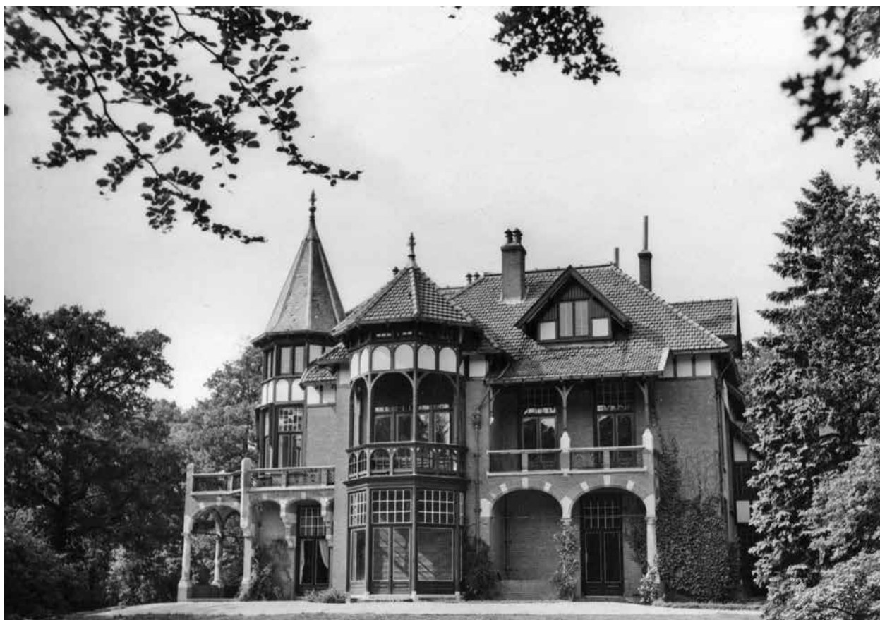
▲ Villa Eikenrode in 1953.

huis. De naam werd gekozen naar analogie van bestaande en gerenommeerde 'rodes' als Berkenrode en Ipenrode .