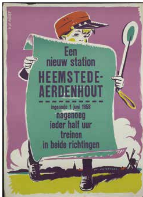
▲ De NS maakte met kleurrijke posters reclame voor het nieuwe station en de dienstregeling met nagenoeg ieder half uur een trein in beide richtingen.

Zijn eerste grote project was het station van Eindhoven, dat in 1956 voltooid werd. Het staat op de Top 100-lijst van Nederlandse monumenten uit de Wederopbouw (1940-1958) en is sinds 2010 een rijksmonument. In totaal bouwde Van der Gaast tussen 1953 en 1988 maar liefst 27 stations. Het haltegebouw in Heemstede is een van zijn vroege ontwerpen. Wim de Wagt kenschetst het in zijn rapport over de wederopbouw in Heemstede en Bennebroek als 'een ontwerp van een hoge architectonische kwaliteit, die wordt bepaald door een evenwichtige combinatie van uitgesproken functionalistische en min of meer traditionele en decoratieve elementen. Typerend voor de tijd van ontstaan zijn ook de constructie, materialen en kleurstelling. Vanwege de - verhoogde - ligging aan een kruispunt van een belangrijke regionale verkeersader is het station een zeer beeldbepalend gebouw. Het vormt als het ware de 'poort' van