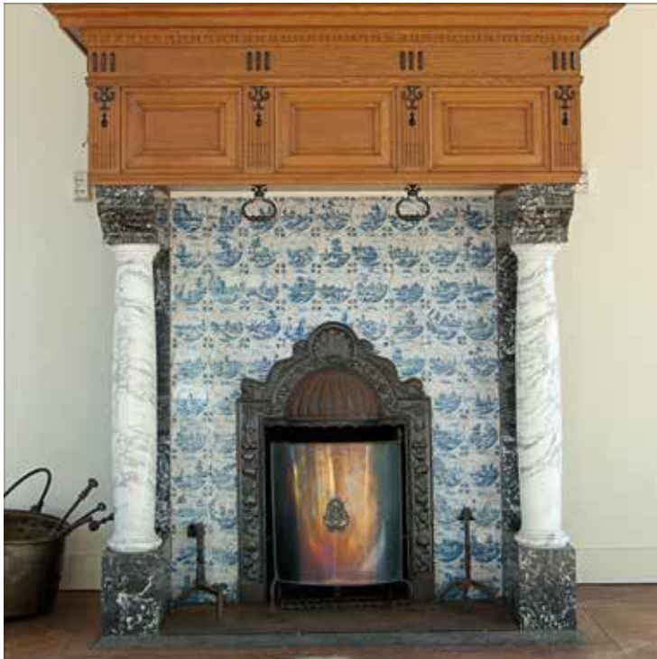
▲ De schouw in de woonkamer van 't Vosje is afkomstig uit Uyt den Bosch.