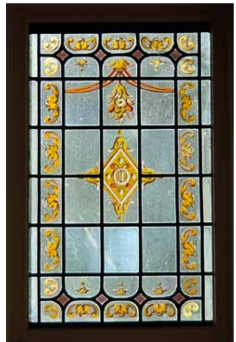
▲ Glas-in-loodraam met het wapen van de Van Hardenbroeks en enkele andere ramen die afkomstig zijn van Uyt den Bosch.