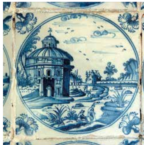
► Eén van de Delftsblauwe tegels op de rijk gedecoreerde schouw.