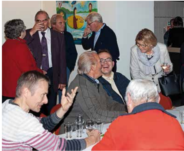
▲ De voor- en de najaarsbijeenkomst hebben niet alleen inhoudelijk gedeelte, maar zijn ook van groot belang voor het contact tussen de leden.

Inzake de Visie Winkelcentra met daarin het voorstel voor een nieuwe supermarkt tussen de Binnenweg en de Eikenlaan in Heemstede, staat de HVHB kritisch tegenover een parkeergarage met ingang en uitgang aan de Binnenweg, aangezien de straat daarmee onacceptabel druk wordt en de omwonenden er negatieve gevolgen van ondervinden.