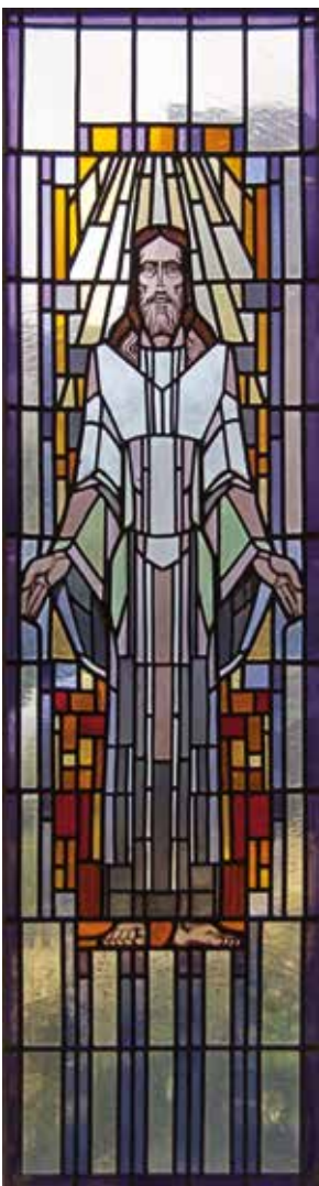
▲ Een van de door Atelier De Vonk uitgevoerde ramen in de Kleine Vermaning.

Een bezoek tijdens de Open Monumentendagen aan de Kleine Vermaning aan de Postlaan werd aanleiding tot een zoektocht naar het Heemstedse atelier voor glassierkunst De Vonk. Al gauw bleek dat de makers van de ramen voor deze doopsgezinde kerk tot ver buiten Heemstede gebouwen en woningen van kleurrijk glas-in-lood hebben voorzien.