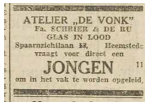
▲ Een advertentie in het Haarlems Dagblad van 29 oktober 1927.