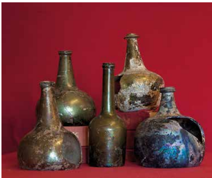
▲ Serie wijnfles- sen, 1700-1800.