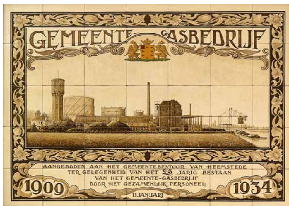
► Dit tegeltableau krijgt een plaats in de hal van het nieuwe appartementengebouw.