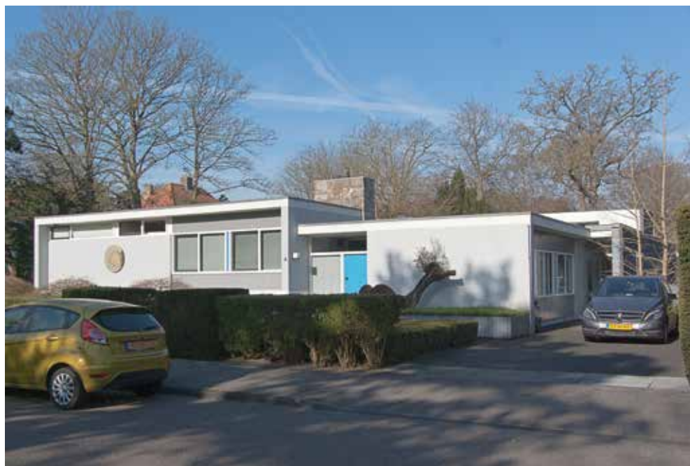
► Burgemeester van Doornkade 4 van de Amsterdamse architect Bart Olaf van den Berg, gebouwd in 1955.

Het toeval wil dat op een steenworp afstand, aan de Burgemeester Van Doornkade 4, een bungalow prijkt die nog sterker dan Dams projecten wortelt in het modernisme. Dit huis werd ontworpen door de Amsterdamse architect Bart Olaf van den Berg, die zowel interieurarchitect als bouwkundig architect was. Met deze, voor de eveneens uit Amsterdam afkomstige familie Van Cleeff gebouwde villa gaf hij een bijzondere proeve van zijn bekwaamheid af: in elkaar geschoven bouwvolumes, een vrije plattegrond, splitlevel opbouw met drive-in garage, de afwisseling van horizontale en verticale bouwdelen en accenten, primaire kleuren wit, grijs en blauw, en ga zo maar door. Een ware weldaad voor de liefhebber, en een parel op de kroon van de wederopbouwarchitectuur in Heemstede.