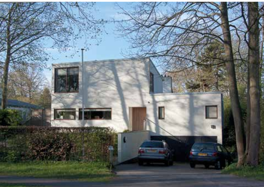
▲ Van Merlenlaan 37 van architect Cees Dam, gebouwd in 1964.

originele, soms ingenieuze verbinding van uitgesproken modernistische ideeën met meer traditionele, uitheemse of plastische elementen. Beide bungalows maken met hun wit geschilderde gevels,