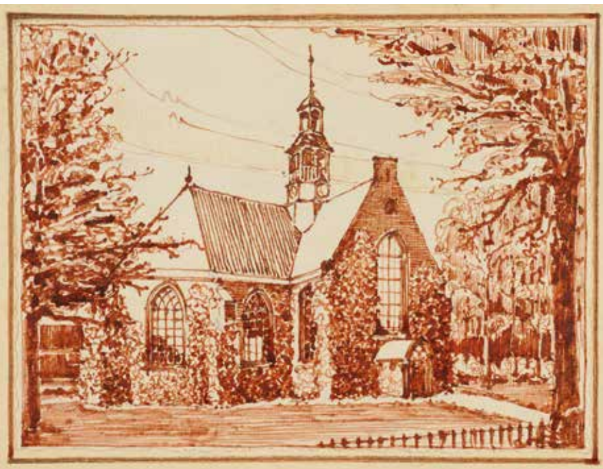
▲ De Oude Kerk aan het Wilhelminaplein.