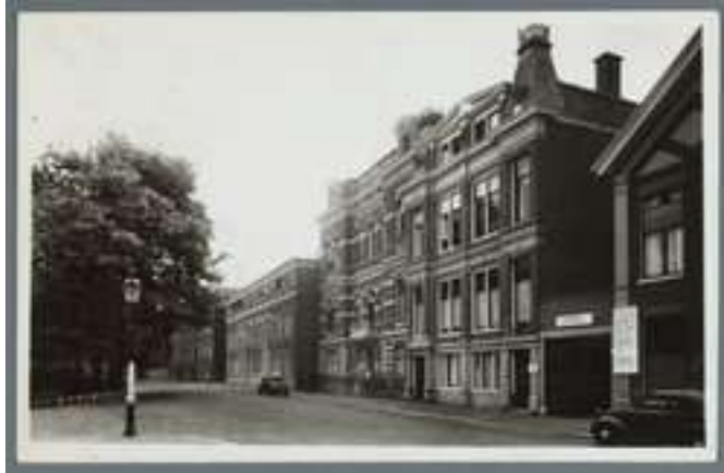
Diaconessenhuis aan de Hazepaterslaan in Haarlem. Hier werd Talma verpleegd en overleed hij op 12 juli 1916.