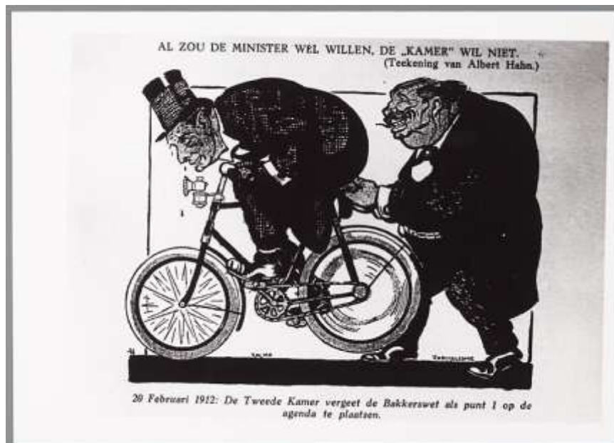
Spotprent van Albert Hahn, februari 1912.

'Zelden is een Minister in ons land zóó mishandeld als hij toen. Botte obstructie noch laffe belediging, hem recht in het gezicht aangedaan, werden hem bespaard. 11