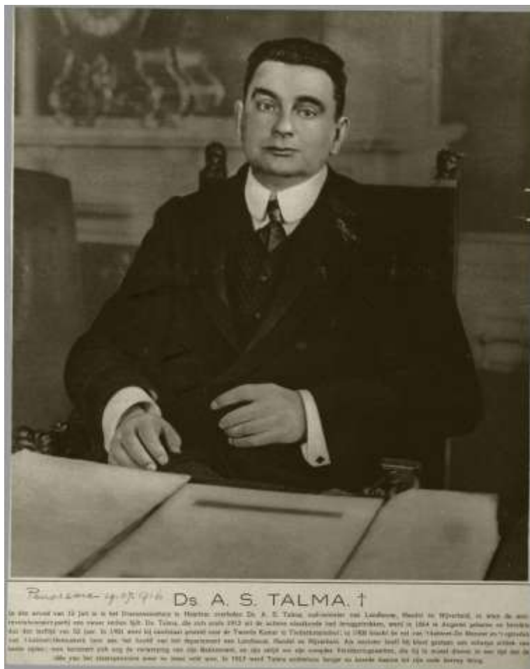
Talma, foto genomen tijdens zijn ministerschap. Panorama, 19-07-1916

morgens naar zijn departement ging en zijn ambtenaren alsdan door zijn voorbeeld leerde, als hij. Zoo was er bij Talma tusschen leer en daad, tusschen woord en voorbeeld de meest volmaakte harmonie.” 16