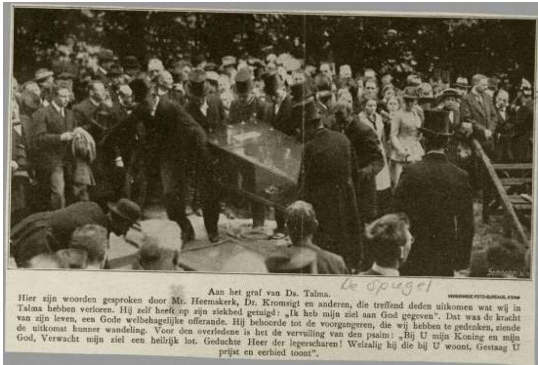
De kist wordt in het graf getild. Foto uit De Spiegel, 19/07/1916