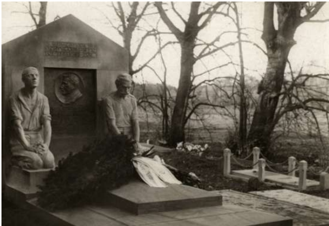
Het graf van Talma naast de Hervormde kerk in Bennebroek, foto uit 1918.

Regelmatig werden er bloemen op het graf van Talma gelegd, zo ook op 12 juli 1941 toen het 25 jaar geleden was, dat hij overleed. Namens het CNV gebeurde dit overigens gedurende een groot aantal jaren ieder jaar. Uiteindelijk is men er mee gestopt. We zouden het in ieder geval weer DV op dinsdag 12 juli 2016 kunnen doen, als we herdenken dat Syb Talma, de rode dominee, honderd jaar geleden overleed. Of wat eerder, op maandag 17 februari 2014, als het honderdvijftig jaar geleden is, dat hij werd geboren. Daarmee herdenken we dan een man die veel heeft gedaan en betekend voor Nederland en die nu rust op het kerkhof van Bennebroek, de plaats waar hij zijn laatste twee jaar doorbracht.