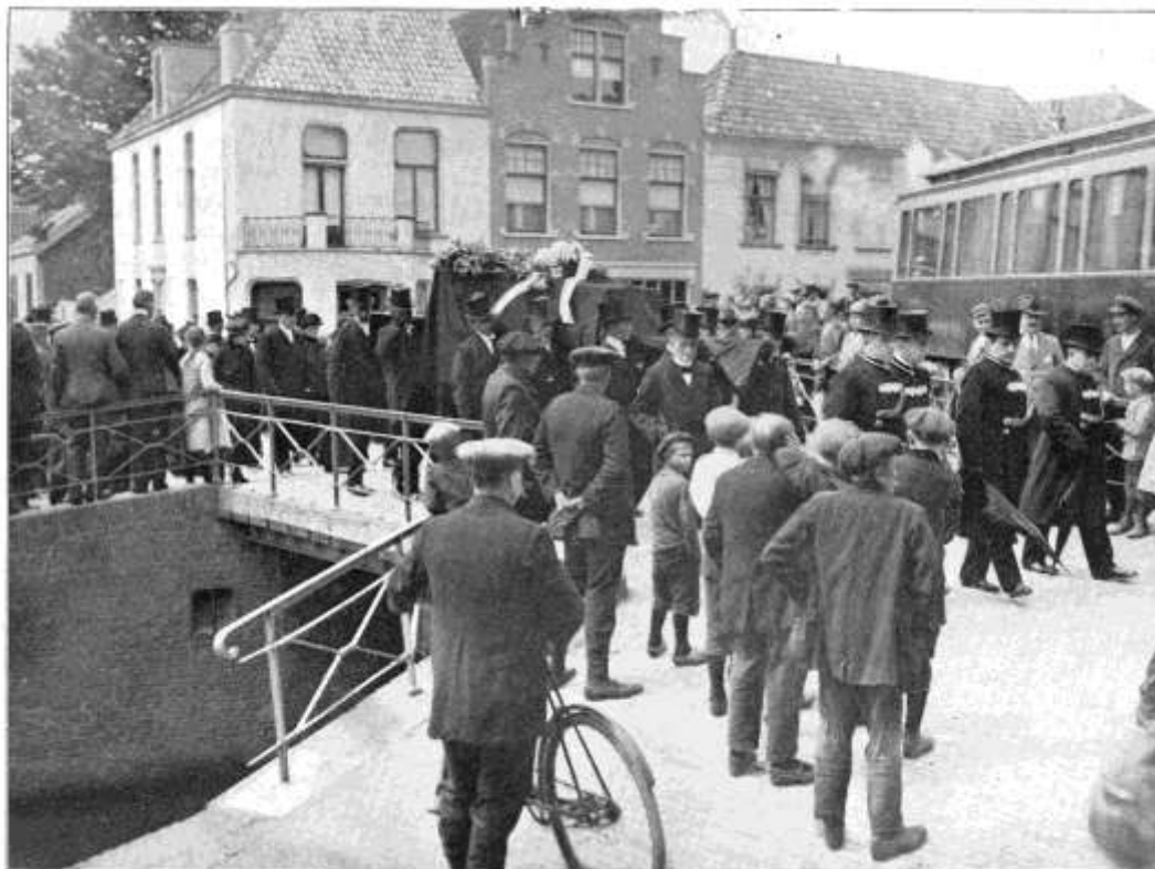
De begrafenis van Oud-Minister A. S. Talma te Bennebroek.