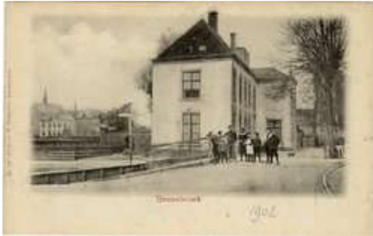
De pastorie op de hoek Meerweg/Schoollaan in Bennebroek, 1902. Links op de achtergrond de R.K. kerk. Rechtsvoor een rails van de tramlijn.