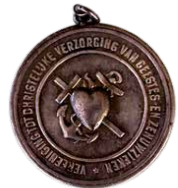
▲ Vignet van de Vereniging tot Christelijke Verzorging van Geestes- en zenuwzieken. ▼ Als detail van het vaandel dat KNA nog steeds gebruikt.