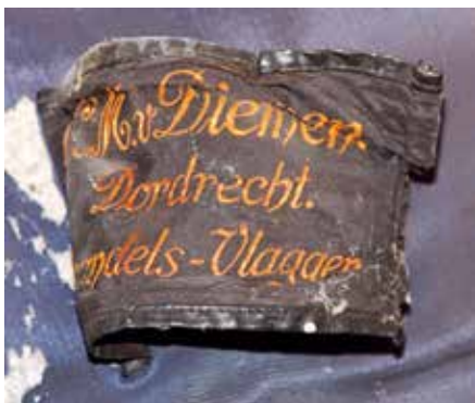
◀ Op de lus waar de stok van het vaandel doorheen gestoken werd staat de naam van de maker, de firma C.M van Diemen uit Dordrecht.