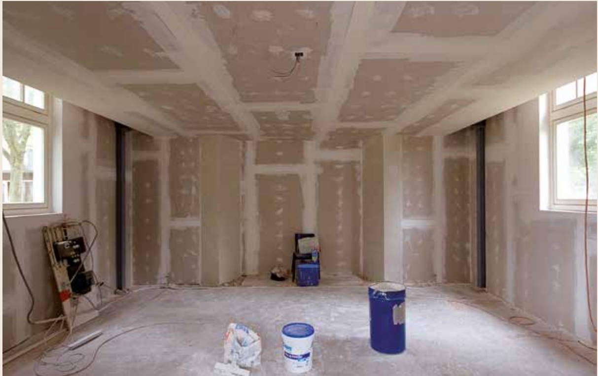
Tijdens de verbouwing in het pomphuis, eind juni 2017.