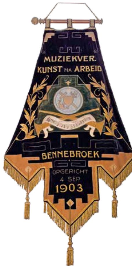
▲ De ontwerptekening van het vaandel van Advendo en het ‘omgebouwde’ vaandel van Kunst Na Arbeid. De tekening had andere kleuren dan het vaandel.