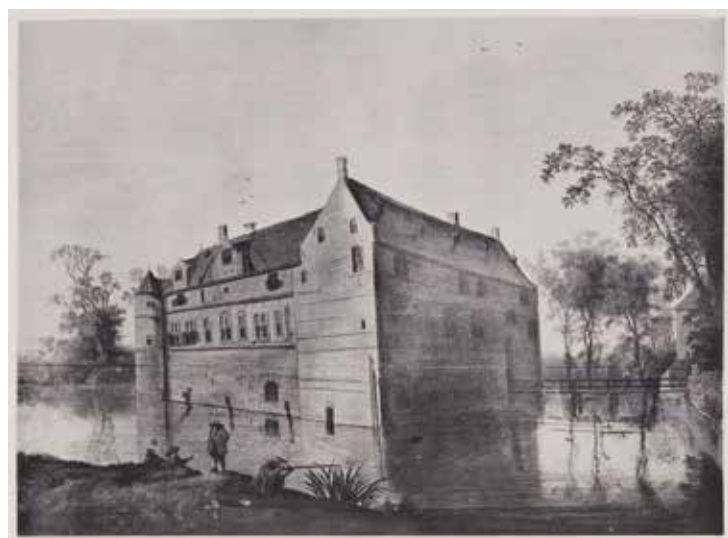
▼ 6. Tekening naar een schilderij, gesigneerd L.R., 1610.