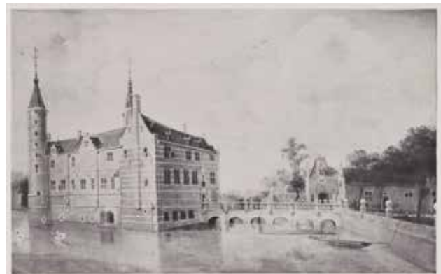
▼ 8. Reproductie van een schilderij van Nicolaas van Berghem (1620-1683), 1646.

Nadat Adriaan Pauw in 1620 de Heerlijkheid Heemstede gekocht had, liet hij het kasteel grondig verbouwen. De toren op de hoek en die op het binnenplein werden hoog opgebouwd, de daken werden met leien bedekt en de tuinen naar de mode van de tijd ingericht.