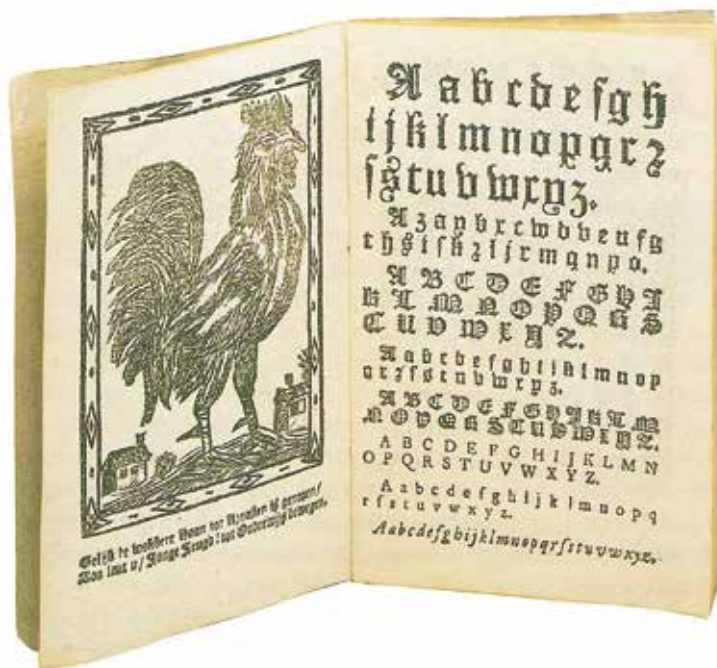
▲ Haneboeken werden vanaf de zestiende eeuw gebruikt. Dit haneboekje (Amsterdam, David le Jolle) is van 1814.

ook niet kon lezen of schrijven. Richtlijnen hoe er met de kleintjes moest worden omgegaan waren er toen ook nog niet. Je kon dus als kleuter pech of geluk hebben, al naar gelang de kwaliteiten van de schoolmatres aan wie je een paar uur per dag was overgeleverd. De matres hield school op eigen initiatief en voor eigen rekening. De ouders betaalden een of twee centen per dag en soms kregen de kleintjes een extra centje mee om bij de matres snoep te kunnen kopen.