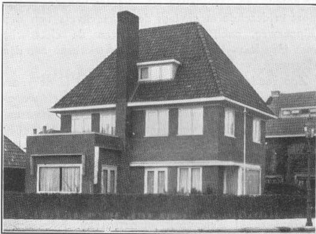
Vrijstaande villa aan de Heemsteedsche Dreef hoek Pieter Aertszlaan Bouwureau Baalbergen en Volkers.

Het onderwijs in Heemstede heeft een buitengewoon goeden naam en mag zich verheugen in grooten bloei. De schoolgebouwen, zoowel openbare als bijzondere, dateeren bijna alle uit de laatste jaren, zijn derhalve zeer modern ingericht en voldoen aesthetisch en hygie-