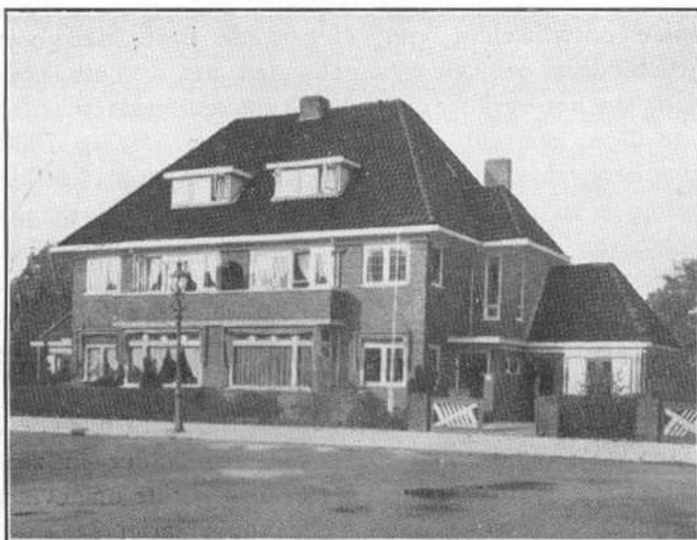
Dubbele villa aan de Pieter Aertszlaan te Heemstede Bouw bureau Baalbergen en Volkers.

duidelijk zijn, dat Heemstede ook in dit opzicht een zeer bevoorrechte positie inneemt.