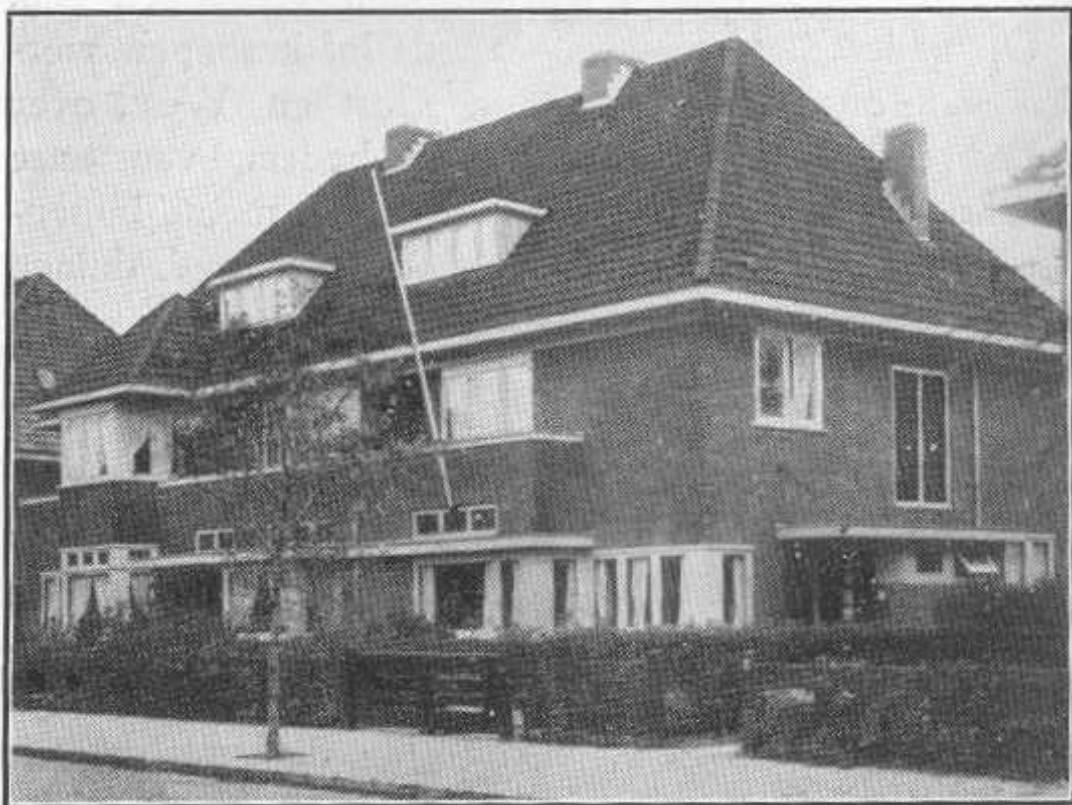
Blok van drie heerenhuizen aan de v.d. Spiegellaan te Heemstede. Bouwureau Baalbergen en Volkers.

Zoo is, om een voorbeeld te noemen, door de electrificatie der spoorwegen de afstand Heemstede—Amsterdam bekort tot 17 minuten, zoodat men even vlug vanuit Heemstede, het centrum van Amsterdam kan bereiken, als vanuit de buitenwijken van Amsterdam zelf.